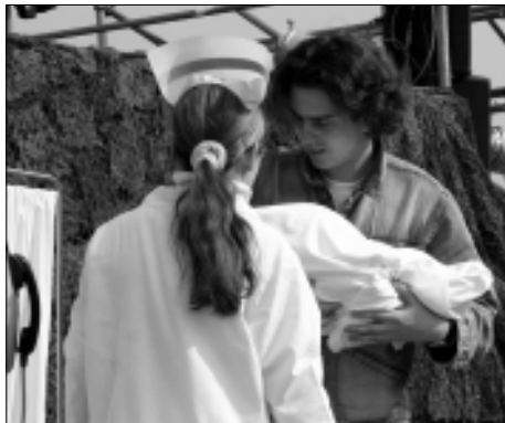
Narodziny Jana Pawła