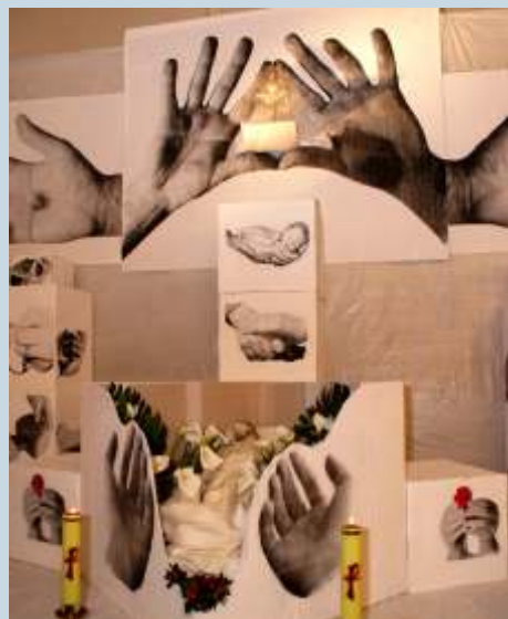
fol. Zosia Pawłowska