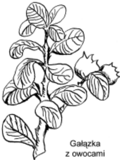
Gałązka z owocami

Bukszpan zwyczajny ( Buxus sempervirens L.) od niepamiętnych czasów jest tak blisko człowieka, że zostaje prawie niezauważalny, zawsze zielony, bardzo gęsty. Jako krzew osiąga wysokość do 1 m, a jako drzewo do 6 m z luźno i spiczasto zakończoną koroną. Kwitnie od marca do kwietnia. Często dla swego wyglądu i odporności sadzony w ogródkach, parkach i na cmentarzach. Zawsze swą zielenią ożywia otoczenie bez względu na porę roku.