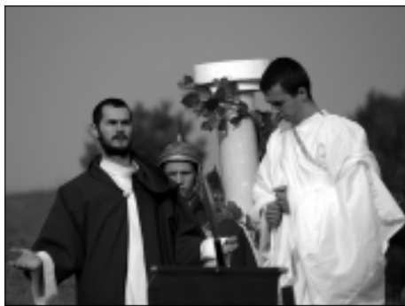
Rozmowa Jezusa z Piłatem