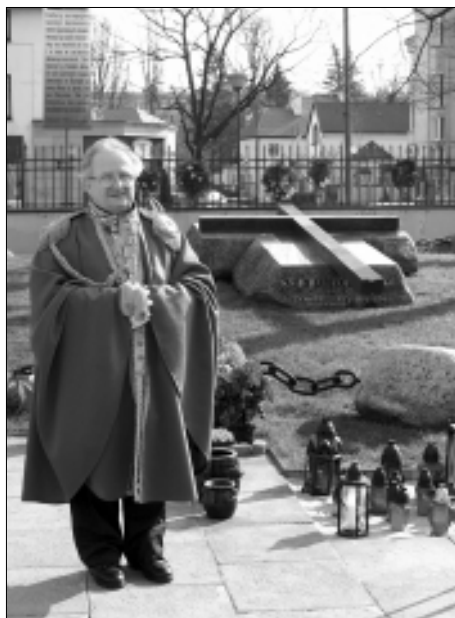
Warta honorowa przy grobie ks. Jerzego Popiełuszki