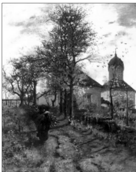
fol. Albert Chmielowski „Opuszczona plebania”

kowskiego (Welon), Stanisława Witkiewicza (Pogrzeb na wsi), Józefa Mehoffera Dziwny ogród. Będzie je można znaleźć na stronie internetowej: www.wiatrak.org.pl .