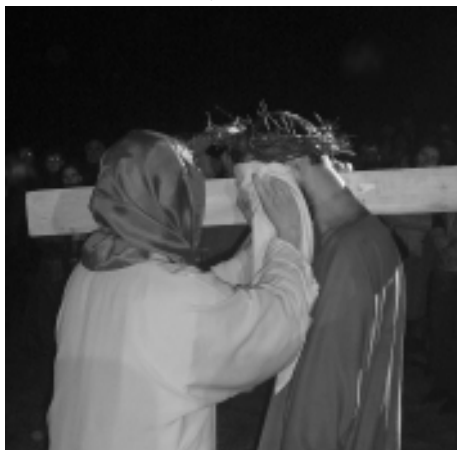
Spotkanie Jezusa z Weroniką