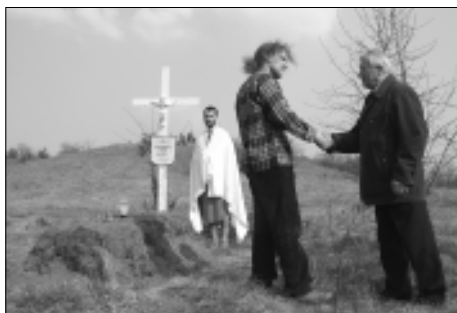
Pojednanie Jana Pawła z ojcem przy grobie matki w obecności zmartwychwstałego Jezusa