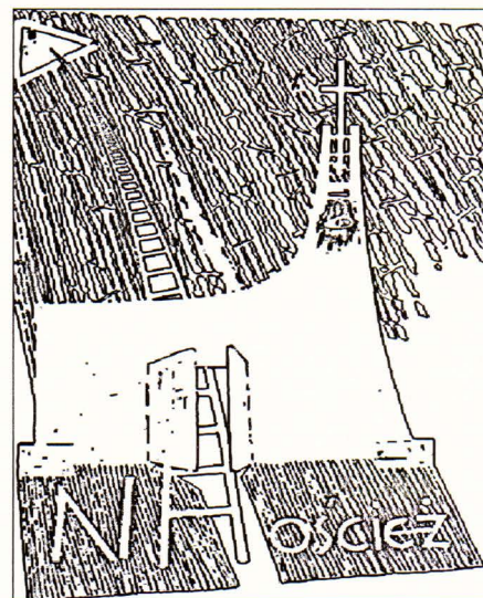
Rys. Jeden z pomysłów - projektów winiety naszego miesięcznika "Na oścież" w wykonaniu Waldemara Zyska

Miesięcznik "Na oścież", ul. gen. Mikołaja Bołtucia 5, 85-791 Bydgoszcz, tel. 346-31-94.