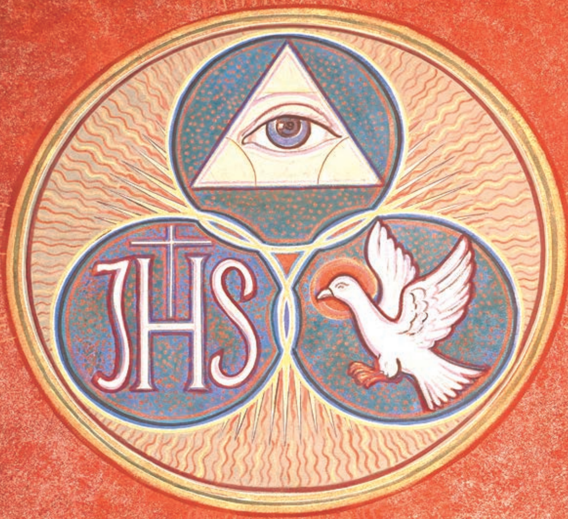
Polichromia ma frontonie Bazyliki z wizerunkiem MB Łaskawej - szczegół - symbole Trójcy Świętej