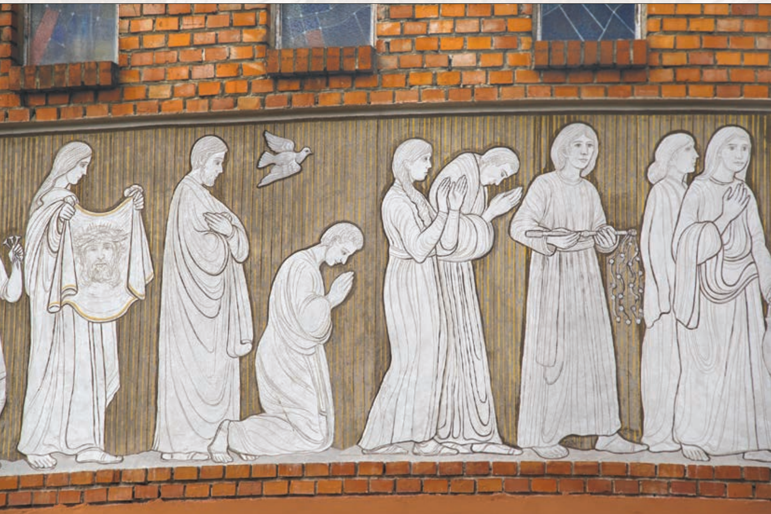
Piąta część pracy malarskiej (od lewej) „Krzyż Drogą Zbawienia”, dokończenie na stronie „Wrzesień 2021”