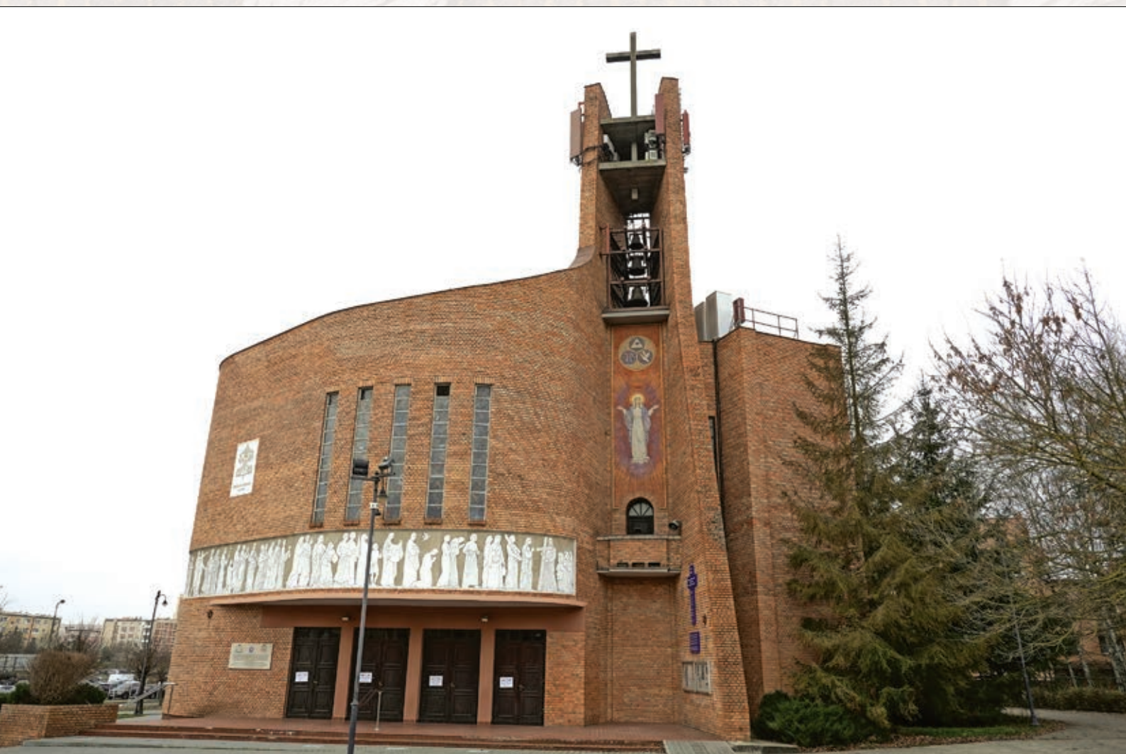
Widok frontonu Bazyliki z herbem Papieskim, pracą malarską „Krzyż Drogą Zbawienia” i polichromią z wizerunkiem MB Łaskawej