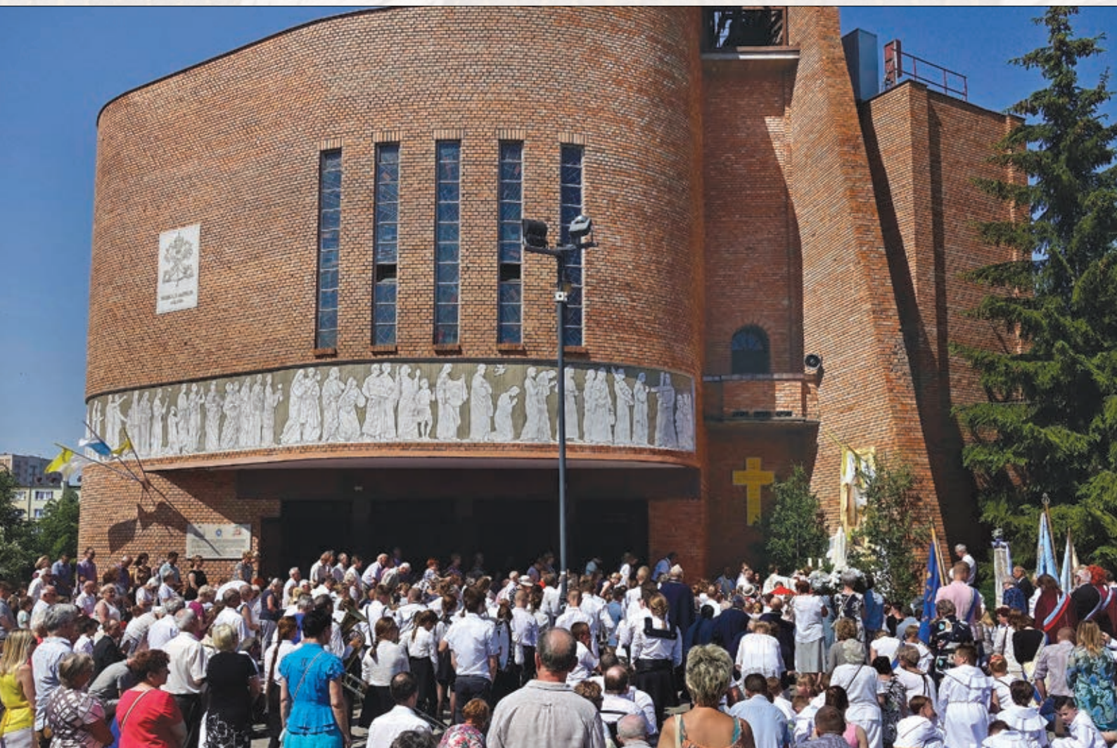
Całość pracy malarskiej w technice sgraffito pt. „KRZYŻ DROGĄ ZBAWIENIA”), fot. Mieczysław Pawłowski