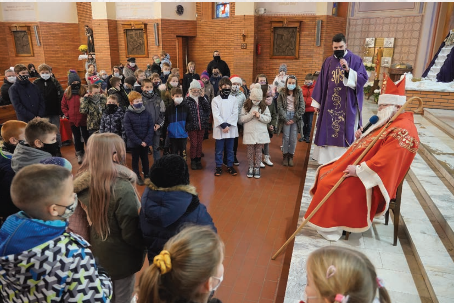
Tegoroczne (w czasie trwania pandemii wirusa COVID-19), tradycyjne spotkanie młodszych parafian ze „Świętym Mikołajem”, fot. Wiesław Kajdasz