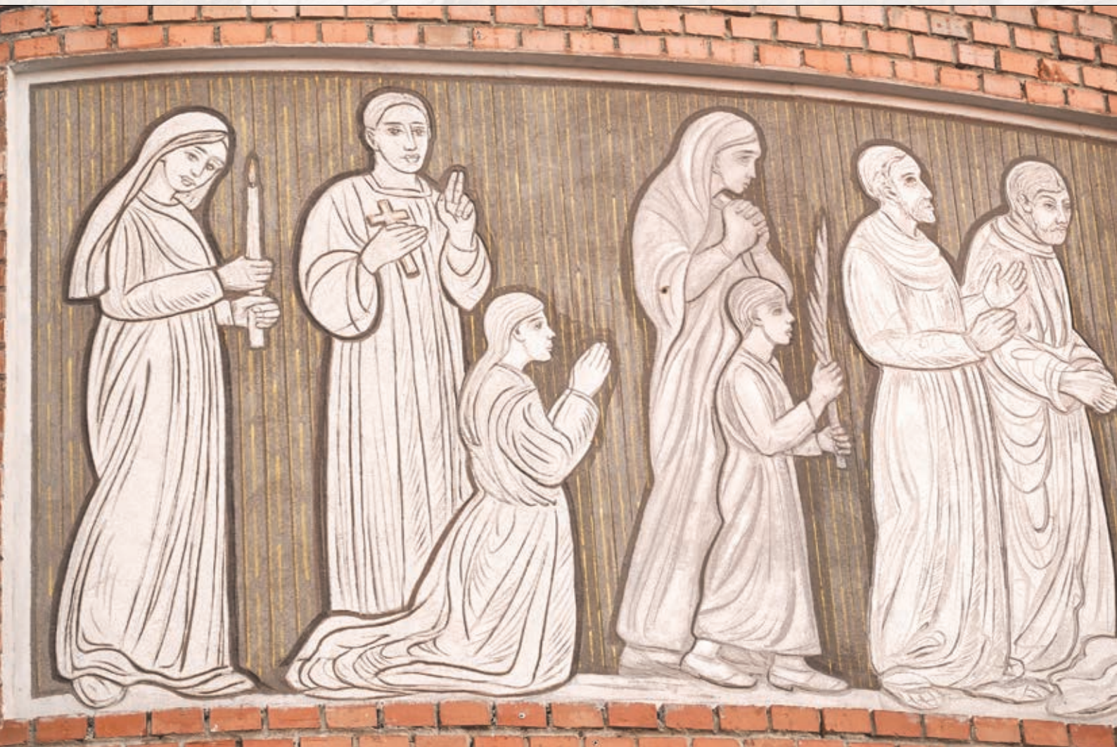
Pierwsza część pracy malarskiej (od lewej) „Krzyż Droga Zbawienia”, cd. na następnej stronie, fot. Wiesław Kajdasz