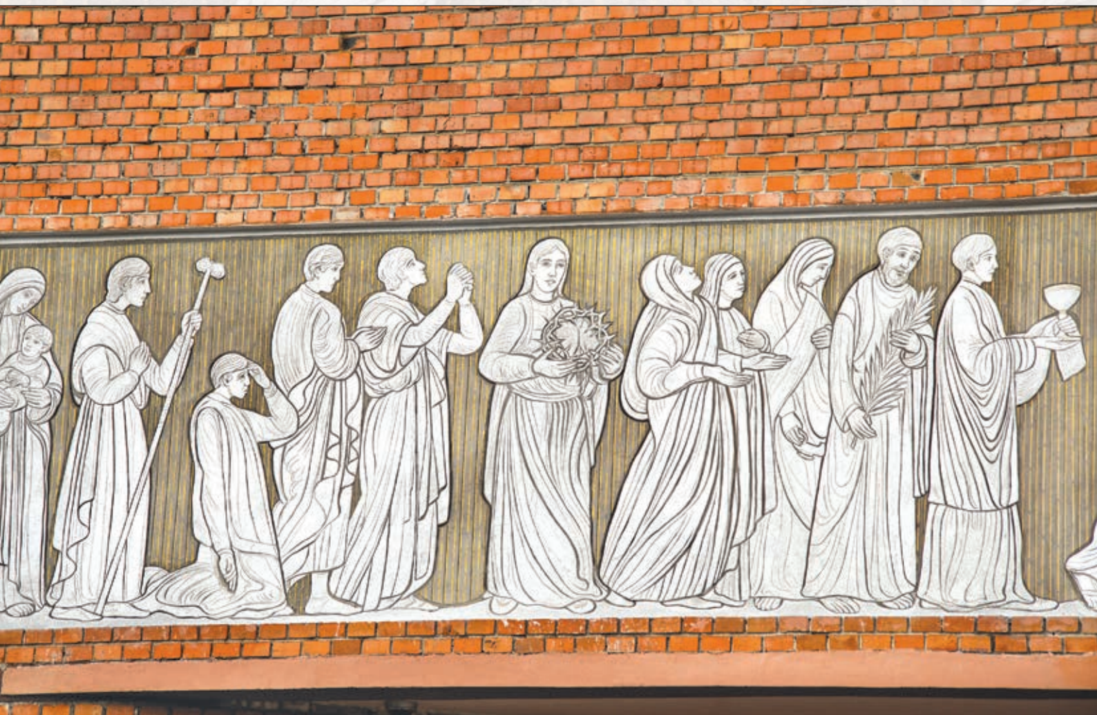
Trzecia część pracy malarskiej (od lewej) „Krzyż Drogą Zbawienia”, cd. na następnej stronie, fot. Mieczysław Pawłowski