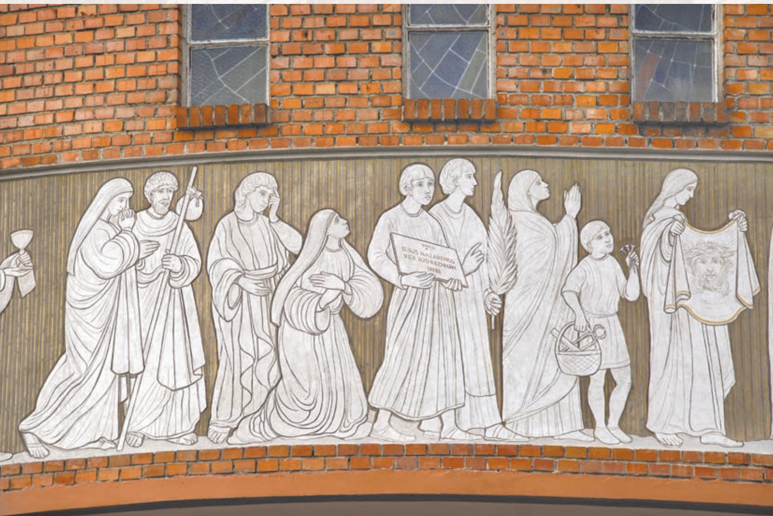
Czwarta część pracy malarskiej (od lewej) „Krzyż Drogą Zbawienia”, cd. na następnej stronie