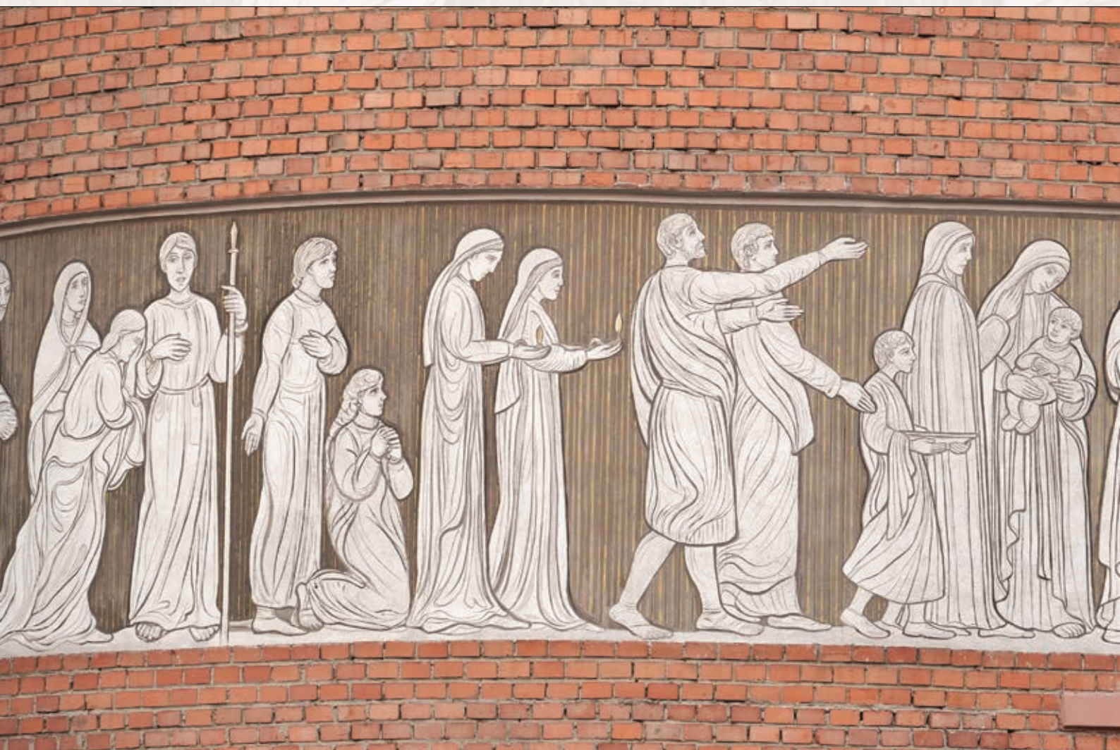
Druga część pracy malarskiej (od lewej) „Krzyż Drogą Zbawienia”, cd. na następnej stronie, fot. Wiesław Kajdasz