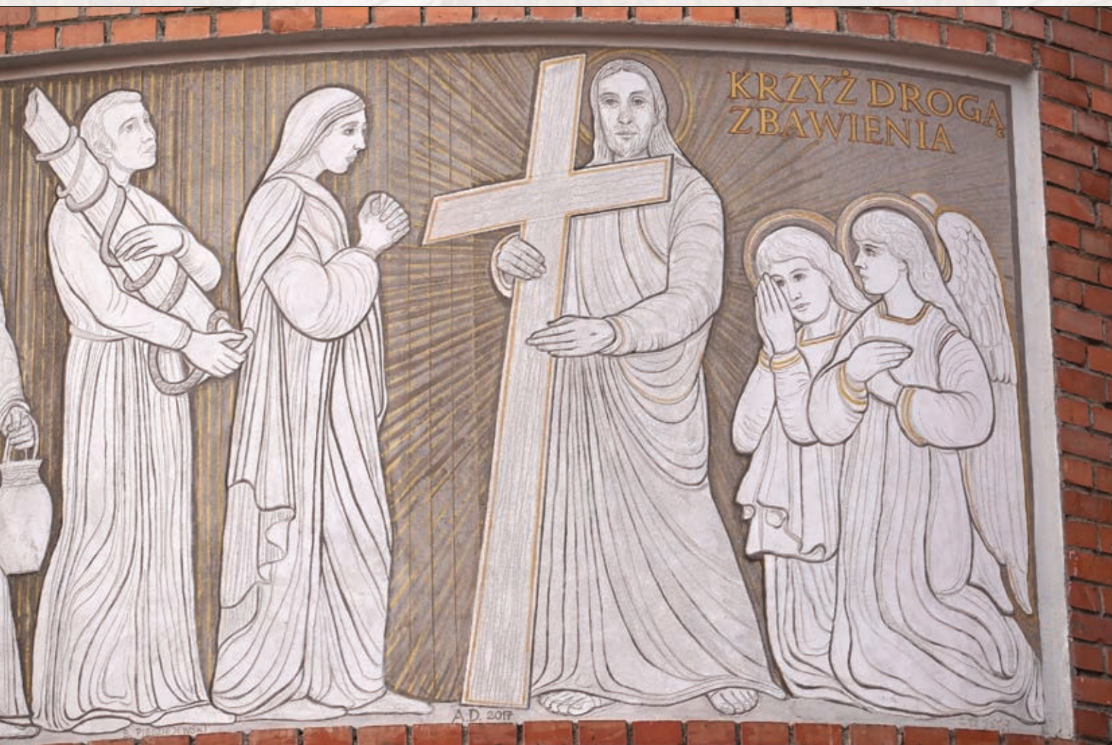
Szósta (ostatnia) część pracy malarskiej „Krzyż Drogą Zbawienia”