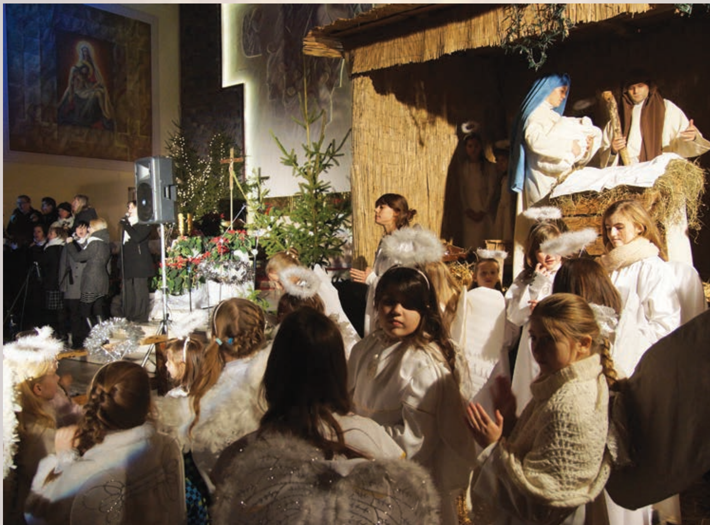
Koncert kolęd pamięci ks. Zygmunta Trybowskiego