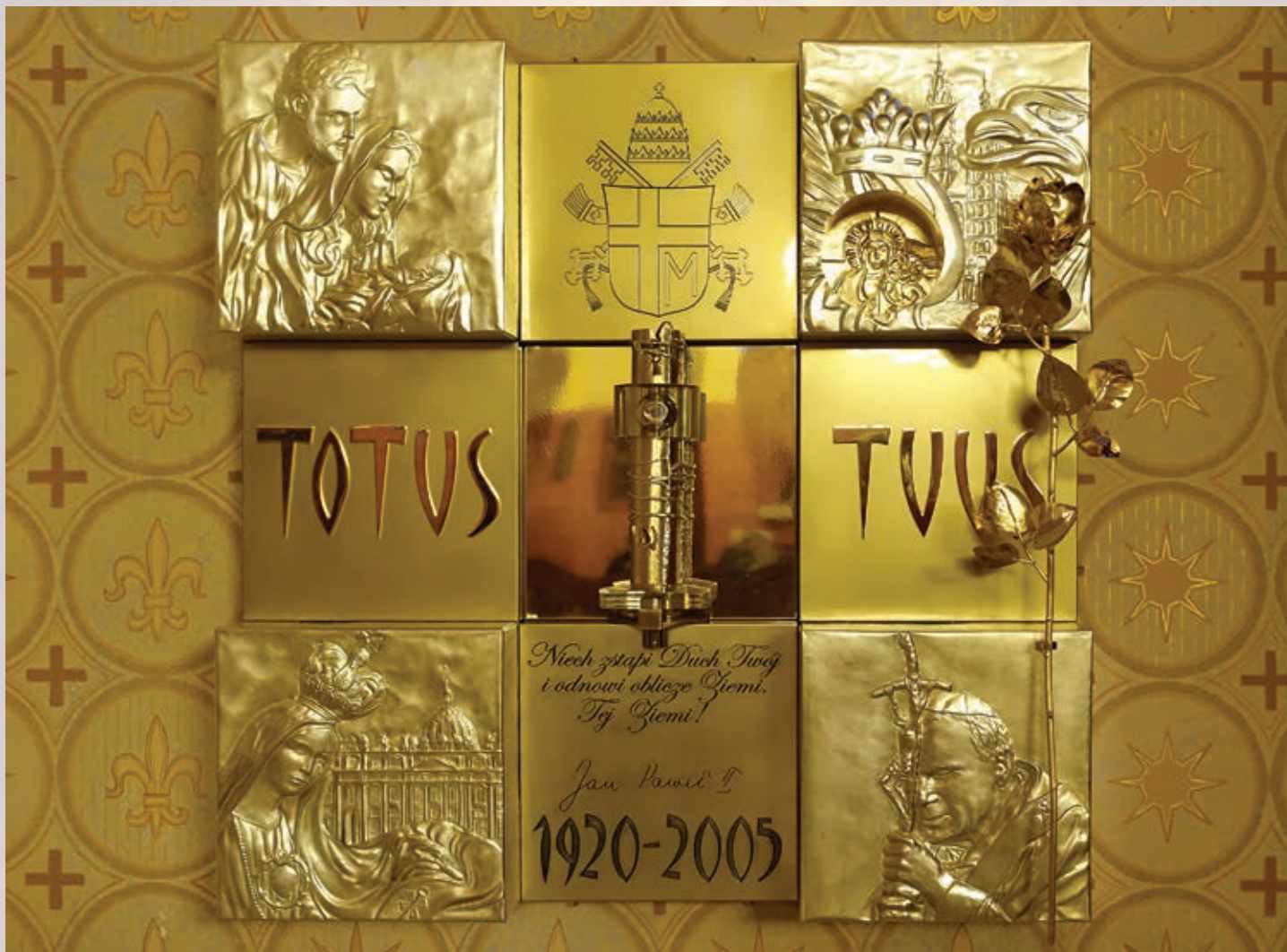
Relikwiarz św. Jana Pawła II, fot. Mieczysław Pawłowski