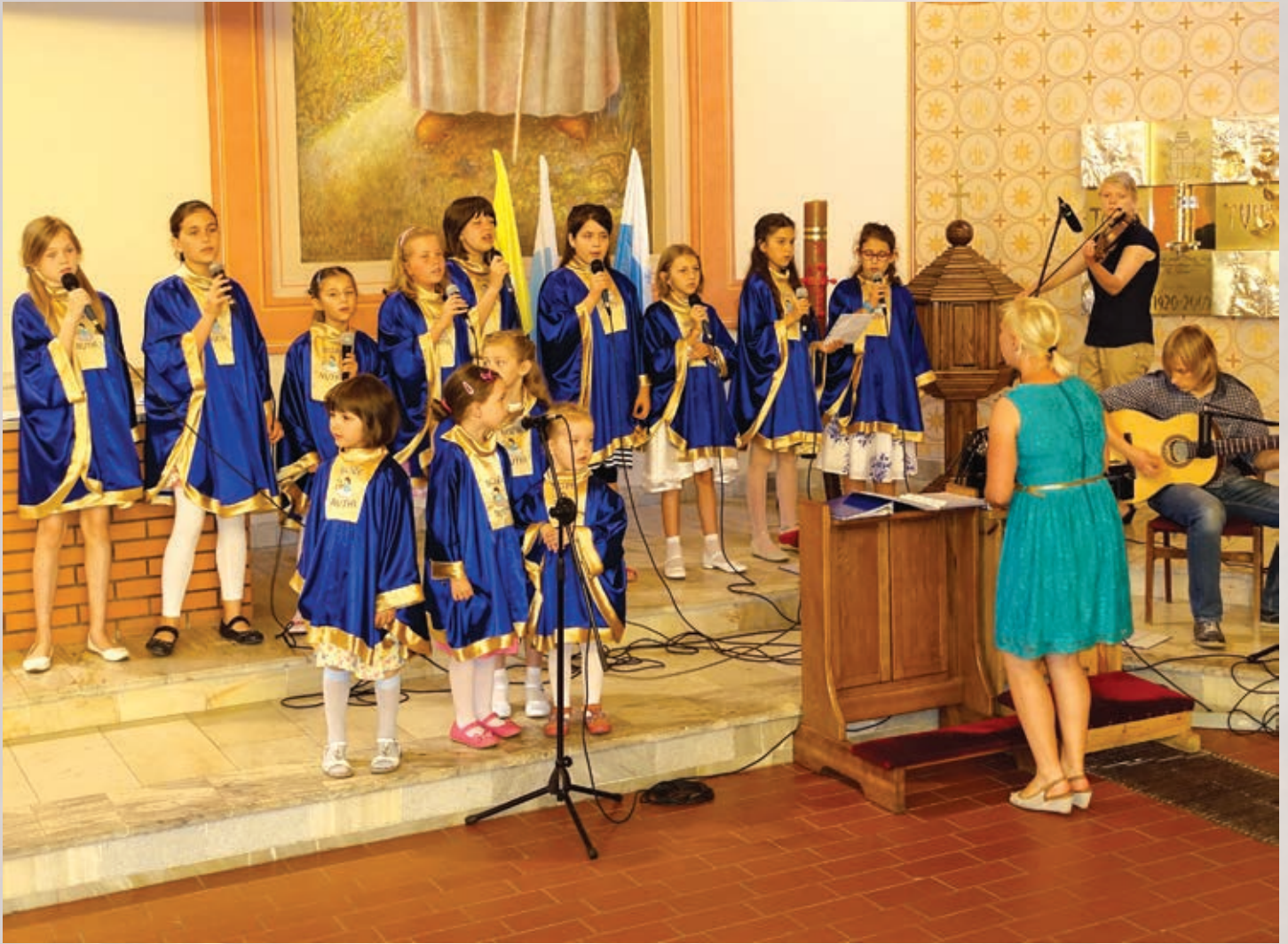
Schola dziecięca „Boże Nutki” ubogacająca parafialne Msze św. dla dzieci