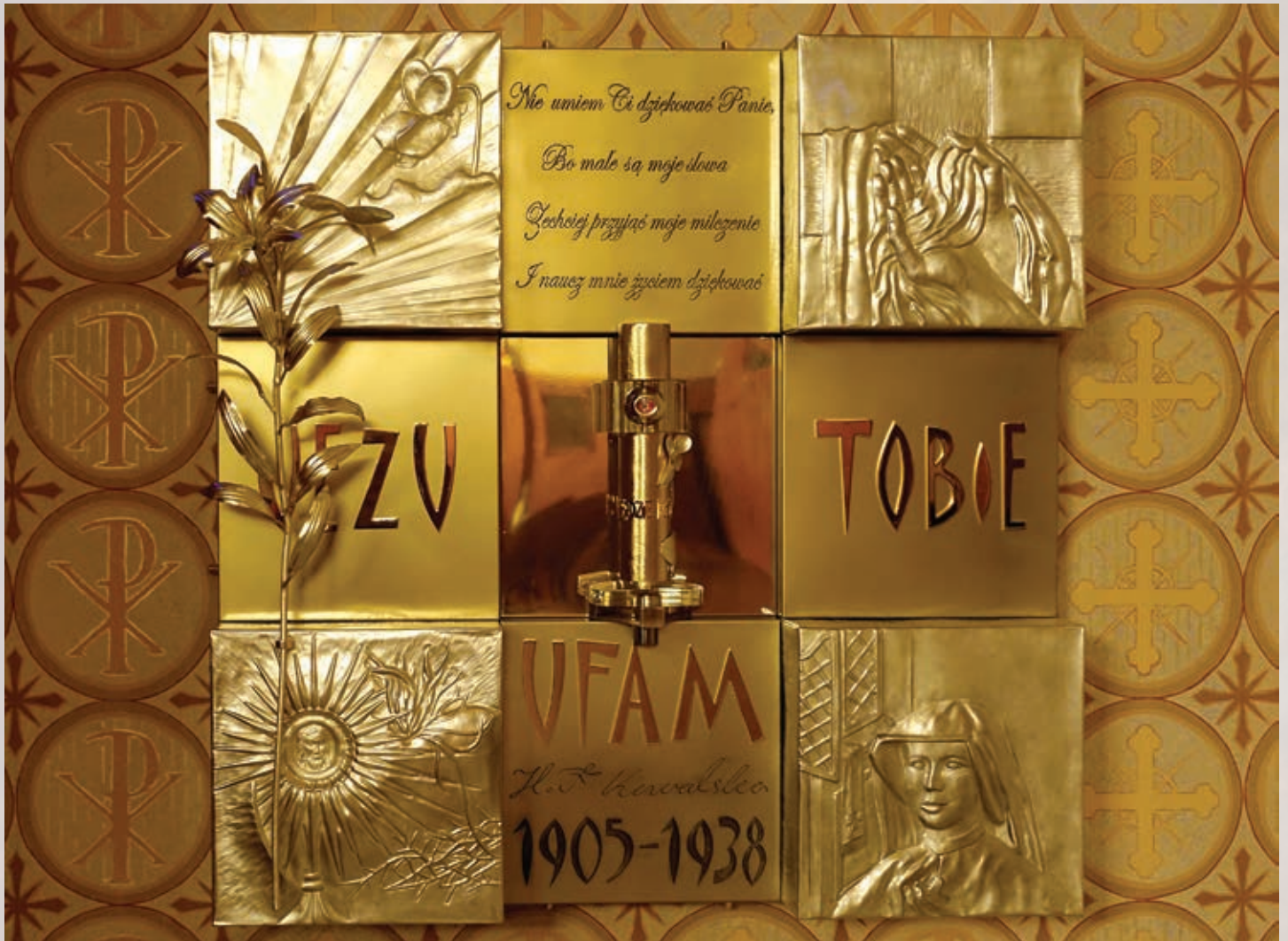
Relikwiarz św. Faustyny