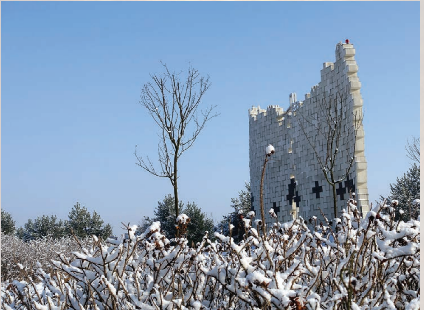
XII stacja Kalwarii Bydgoskiej Golgoty XX Wieku