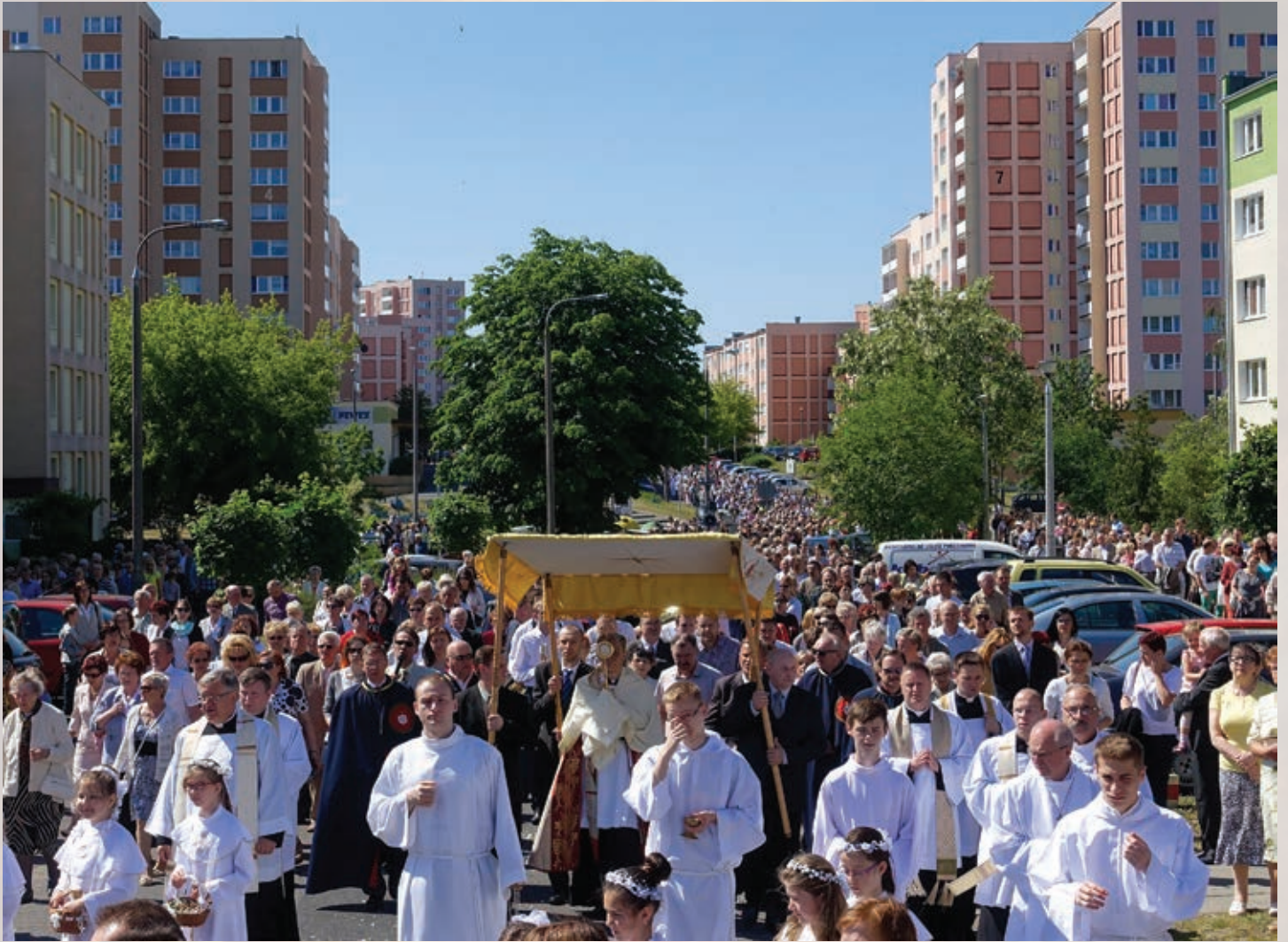
Procesja Bożego Ciała ulicami parafii