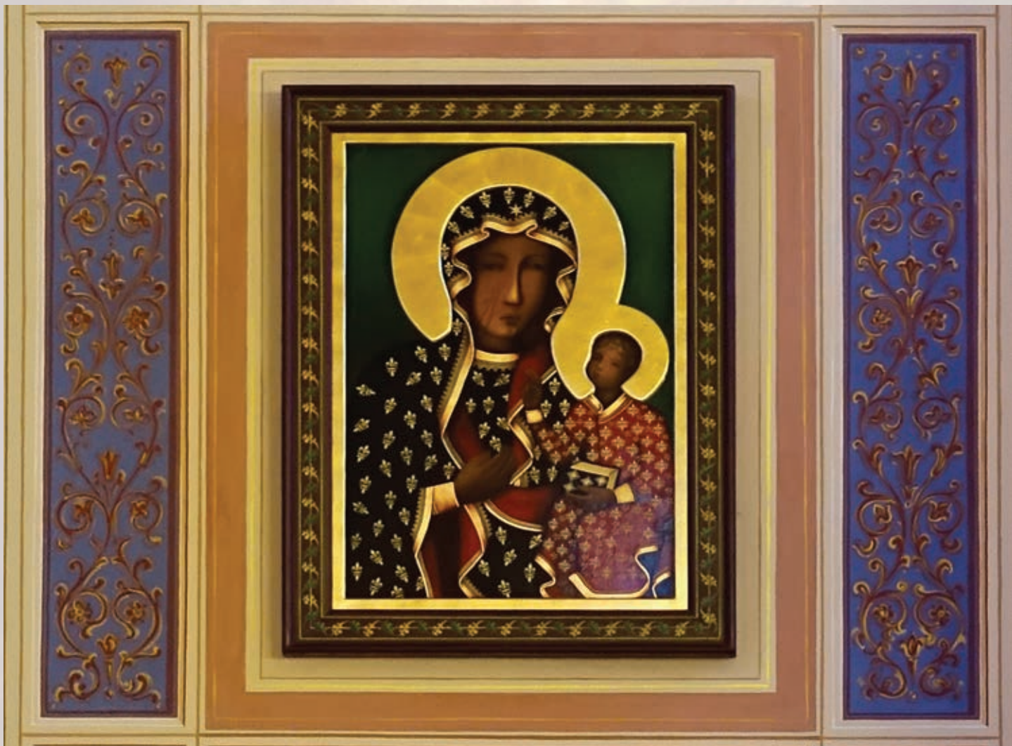
Nowa oprawa obrazu Matki Bożej Częstochowskiej, fot. Mieczysław Pawłowski