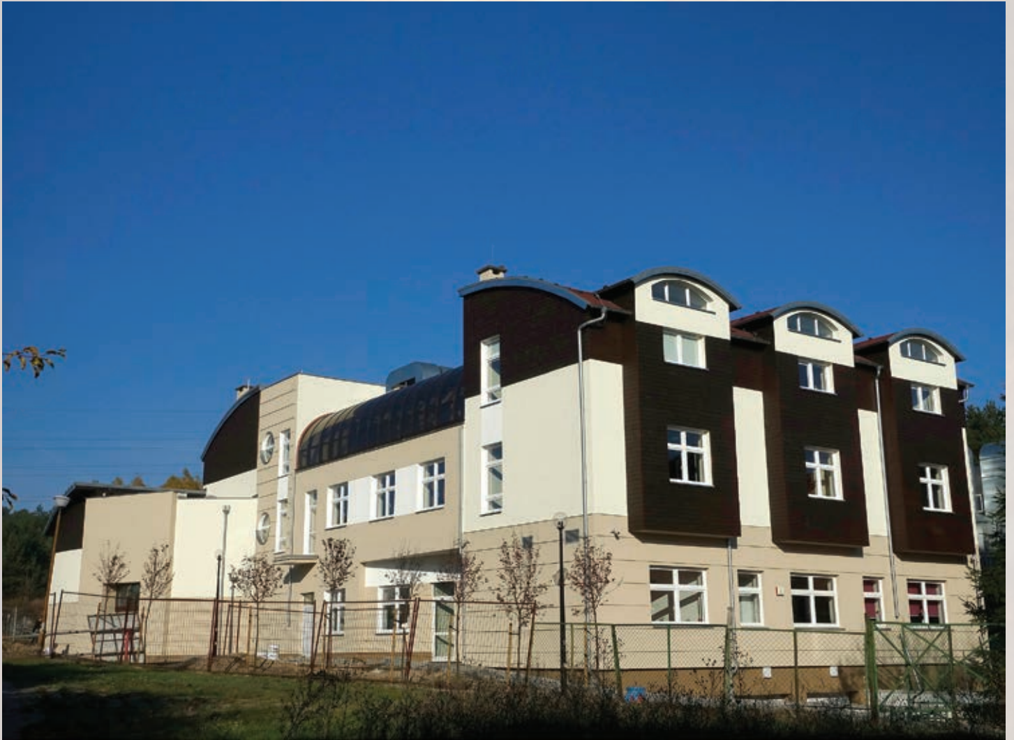
Dom Jubileuszowy im. Jana Pawła II