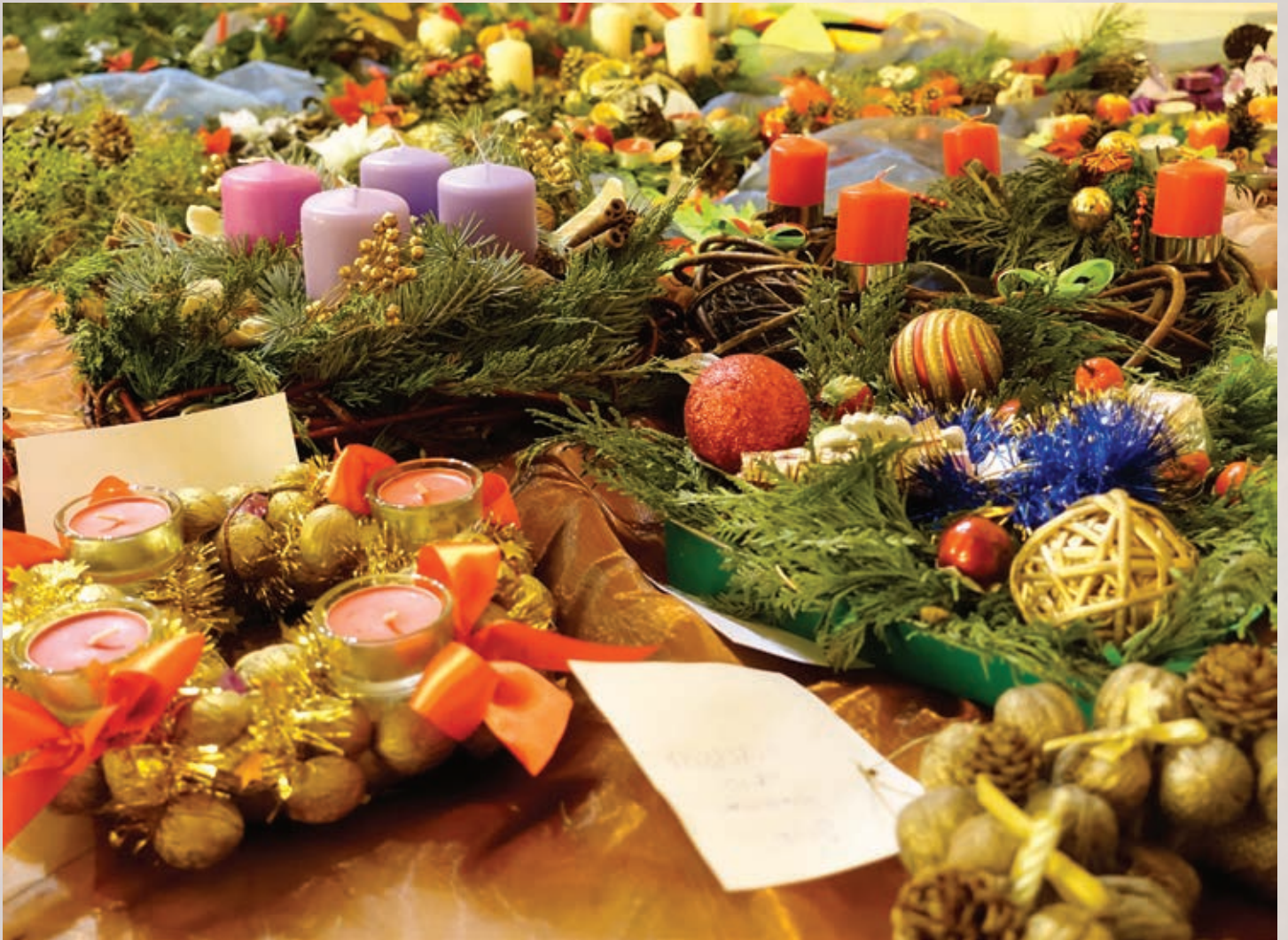
Finał dorocznego konkursu na najpiękniejszy wieniec adwentowy organizowanego przez „Wiatrak”