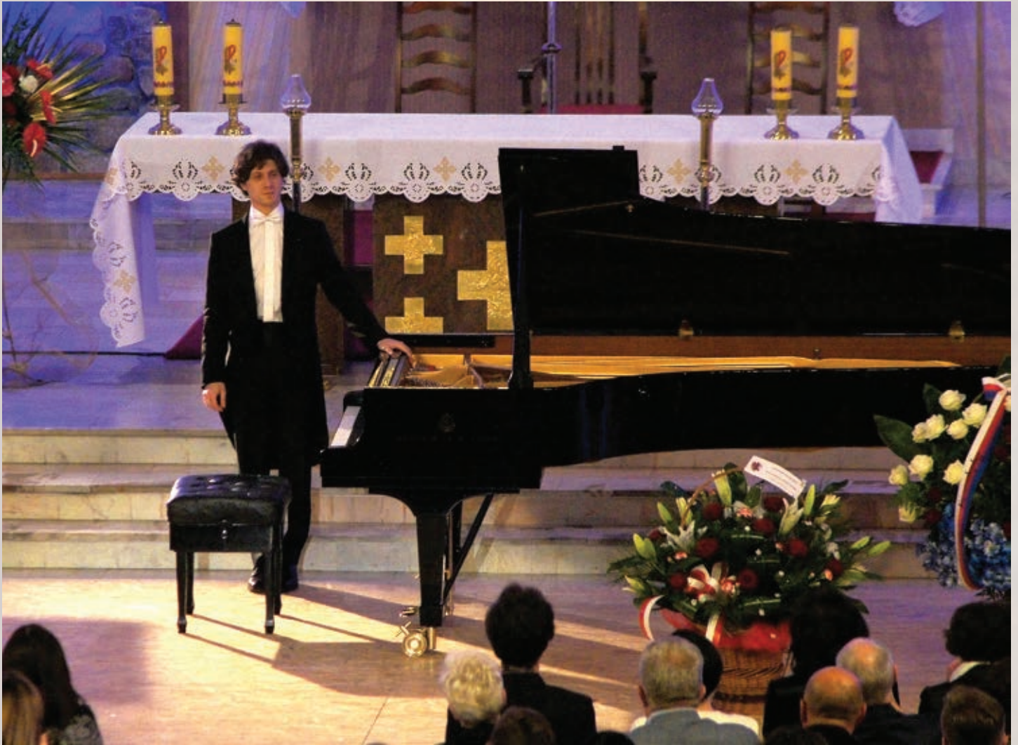
Recital fortepianowy Rafała Blechacza w bazylice MBKM w Bydgoszczy w X rocznicę zwycięstwa w Konkursie Chopinowskim