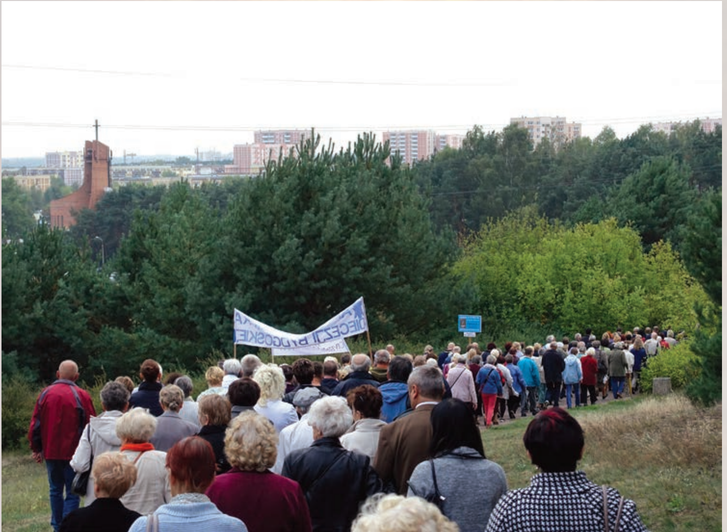
V Bydgoska Droga Krzyżowa w Dolinie Śmierci organizowana przez katolickie wspólnoty diecezji bydgoskiej